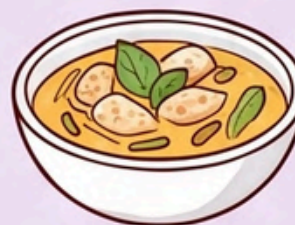
แกงไต่ คั่วหยวก

เป็นผลผลิตและเมนูเชิดหน้าจูด้าไม้กปราก ในงานวัฒนธรรมและจองดินาหม่อน