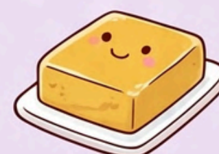
ทุเรียนกวน